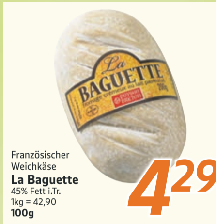
Französischer Weichkäse La Baguette 45% Fett i.Tr. 1kg = 42,90 100g