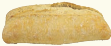
Classic Ciabatta* 1kg = 1,79 330g Stück