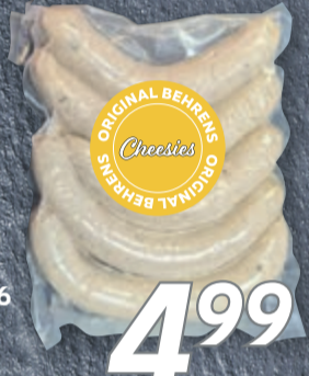
Gold prämiertes Meisterstück 2026 Cheesies unsere Käse-Bratwurst 5er Packung