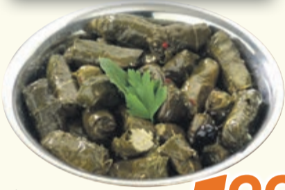
Weinblätter mit Reis 1kg = 19,90 100g