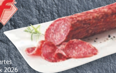
Gold prämiertes Meisterstück 2026 Twuster Stracke unsere luftgetrocknete Mettwurstspezialität, in dünnen Scheiben aufgeschnitten, 100g