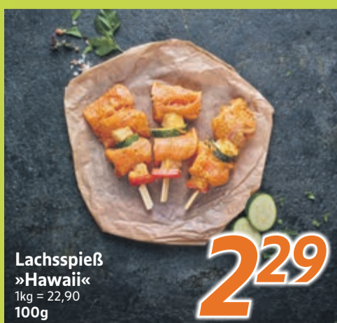
Lachsspieß »Hawaii« 1kg = 22,90 100g