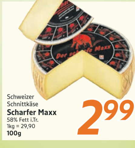
Schweizer Schnittkäse Scharfer Maxx 58% Fett i.Tr. 1kg = 29,90 100g