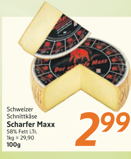
Schweizer Schnittkäse Scharfer Maxx 58% Fett i.Tr. 1kg = 29,90 100g