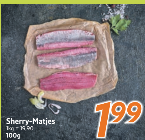
Sherry-Matjes 1kg = 19,90 100g