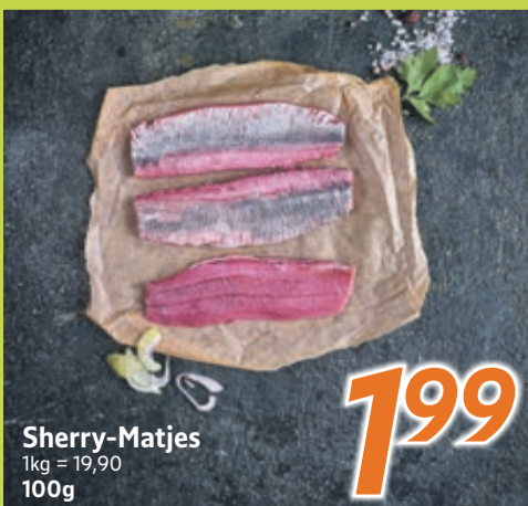
Sherry-Matjes 1kg = 19,90 100g