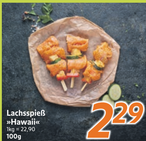
Lachsspieß »Hawaii« 1kg = 22,90 100g