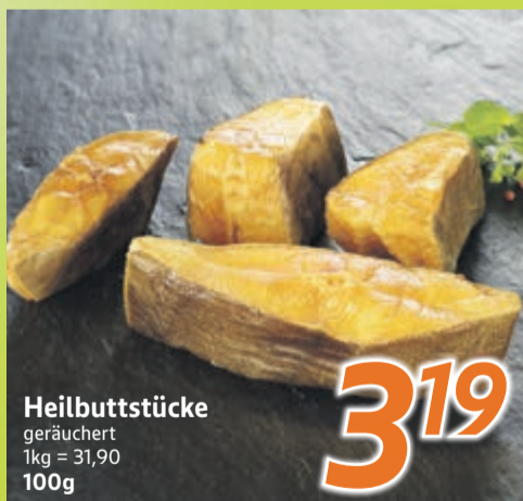
Heilbuttstücke geräuchert 1kg = 31,90 100g