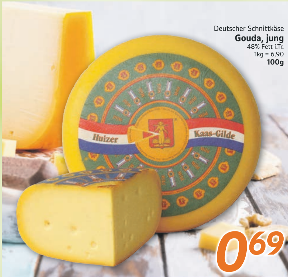
Deutscher Schnittkäse Gouda, jung 48% Fett i.Tr. 1kg = 6,90 100g