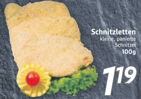
Schnitzletten kleine, panierte Schnitzel 100g

Erhältlich in folgenden inkoop-Märkten: Bahnhofstraße 13, 27211 Bassum Wildeshauser Straße 2, 27243 Harpstedt Jupiterstraße 2, 28816 Stuhr-Brinkum