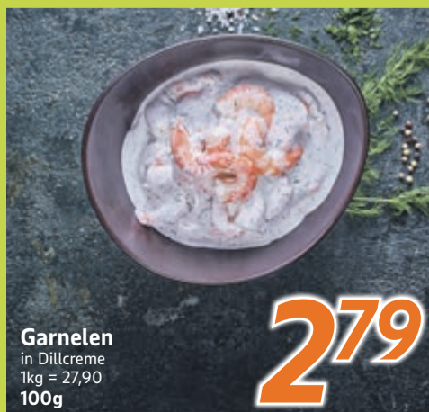
Garnelen in Dillcreme 1kg = 27,90 100g