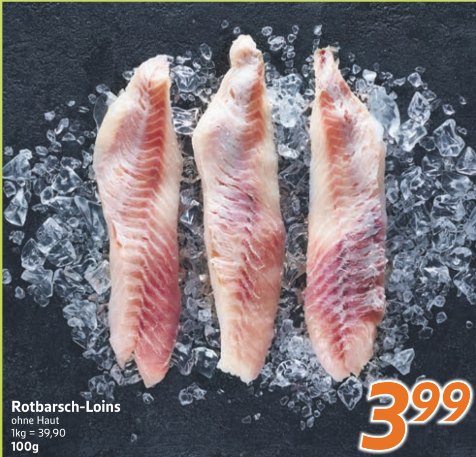
Rotbarsch-Loins ohne Haut 1kg = 39,90 100g