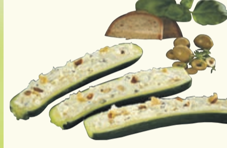
Aus eigener Herstellung: Zucchini-Schiffchen mit Schafskäse-Oliven-Creme 1kg = 19,90 100g