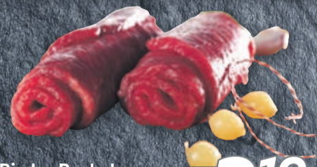
Rinder-Rouladen aus der Oberschale, zum selber füllen 100g

Und zusätzlich ab Donnerstag 04.06.2026: