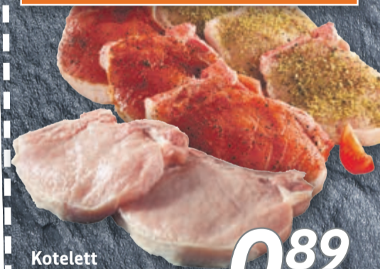
Kotelett natur oder gewürzt 100g

Nur Montag 01.06.2026 bis Mittwoch 03.06.2026 und solange der Vorrat reicht: