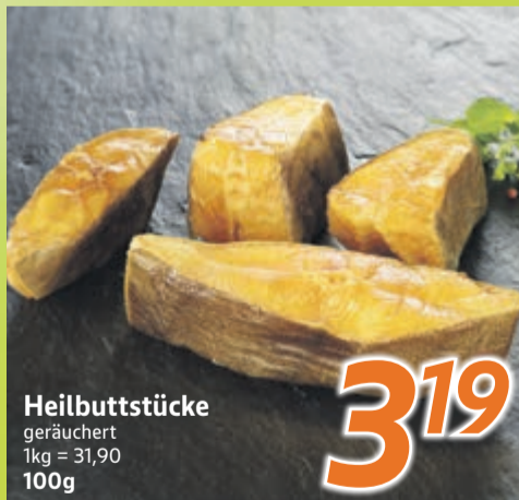
Heilbuttstücke geräuchert 1kg = 31,90 100g